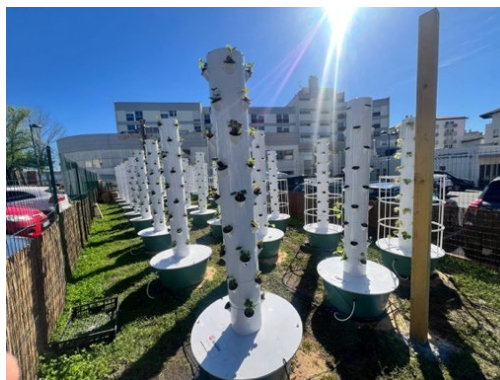
Clinique Aguiléra : 30 fermes installées sur une parcelle du parking