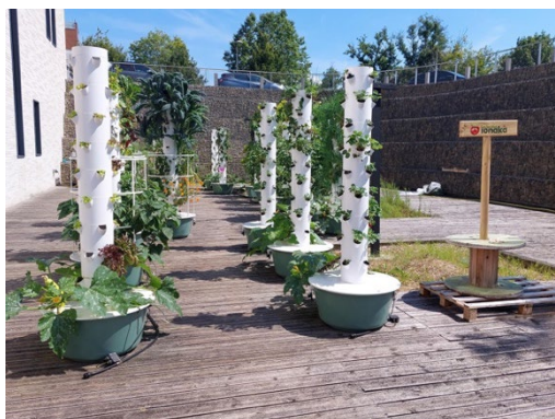
Clinique Belharra : 20 fermes installées au rez-de-jardin sur une partie de la terrasse