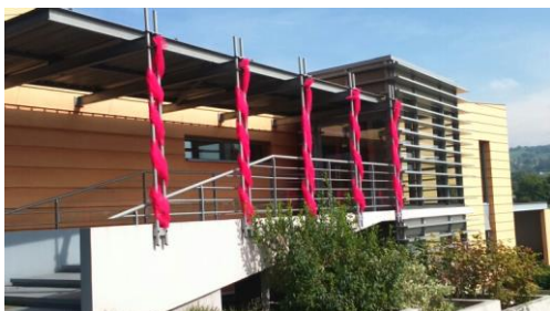
Entrée du centre